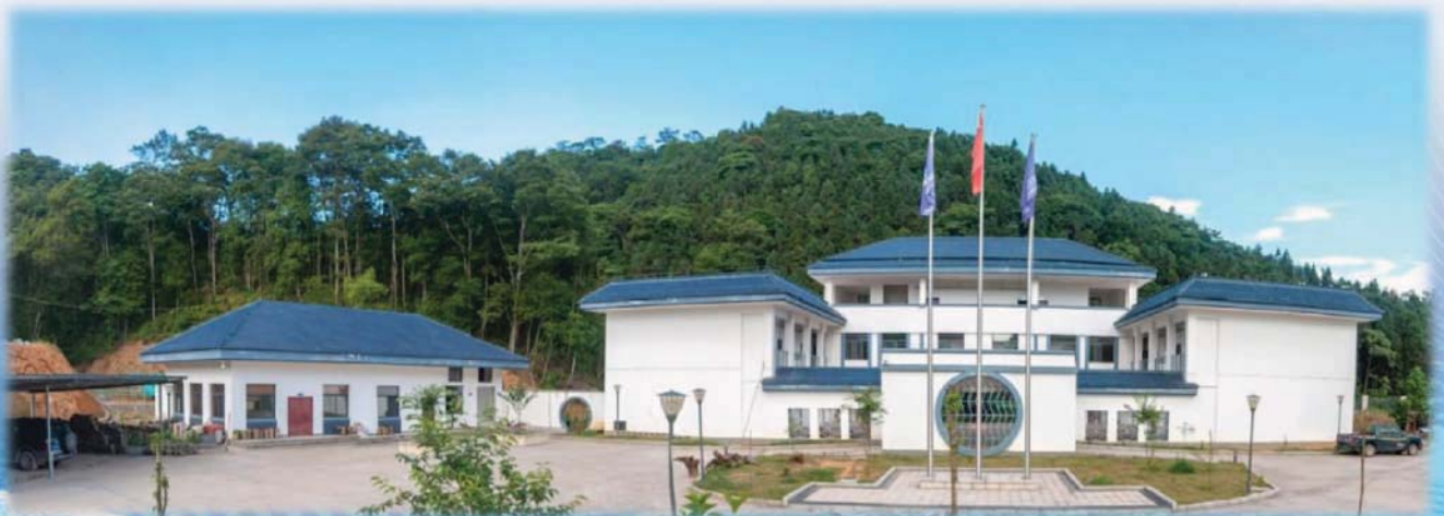
福建三明森林生态系统国家野外科学观测研究站

学院近 5 年在 Nature ,Nature Communications ,PNAS ,Ecology Letters ,Biological Reviews ,Global Change Biology 等国际学术期刊上发表论文 400 余篇，出版专著 16 部，授权发明专利 12 项，制定国家标准 1 项、福建省地方标准 1 项，获省部级奖 34 项。